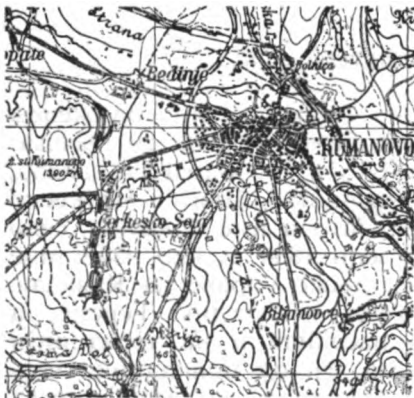
Сл. 1 — Данашње Черкеско Село крај Куманова

Након Другог светског рата настале су нове измене у Черкеском Селу: од 1956. до 1960. иселила су се у Турску поменута черкеска домаћинства, док су српска домаћинства прешла у Куманово. На места ових исељеника дошли су нови бројни албански становници. Насељавање Албанаца не престаје и сада. Године 1964. у Черкеском Селу саграђена је велика џамија, док је на том месту била мања черкеска џамија срушена у рату 1912. године. Крај те џамије Черкези су имали дућан и ковачницу.