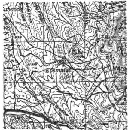
Сл. 2 — Данашње село Косматац у Кумановској области