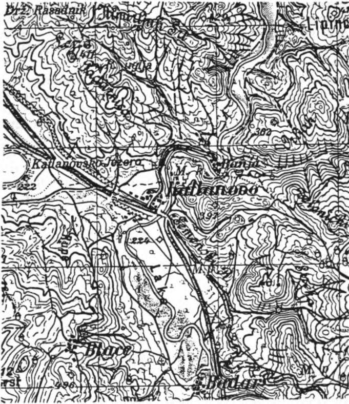
Сл. 3 — Око Катланова и Катлановске Бање постојала су три черкеска насеља: Мецидија, Катлановска Бања и Саразанли

Насеље је постојало само 34 године — до 1912. Те године имало је 25 домаћинстава. У Балканском рату Черкези су се иселили у Турску, док су њихове куће запаљене.